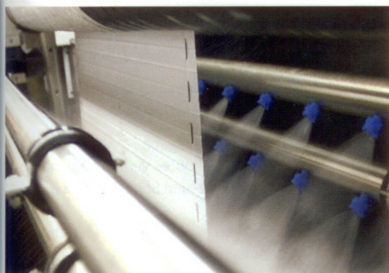
Plissee wird im Vollautomaten TFR 2200 formstabil gereinigt.

Der Verband hat die unterschiedlichen Reinigungsmethoden für Flächenvorhänge, Plissees, Rollos, Raffrollos und Screens getestet. Das Bürsten-Walzen-Reinigungsverfahren