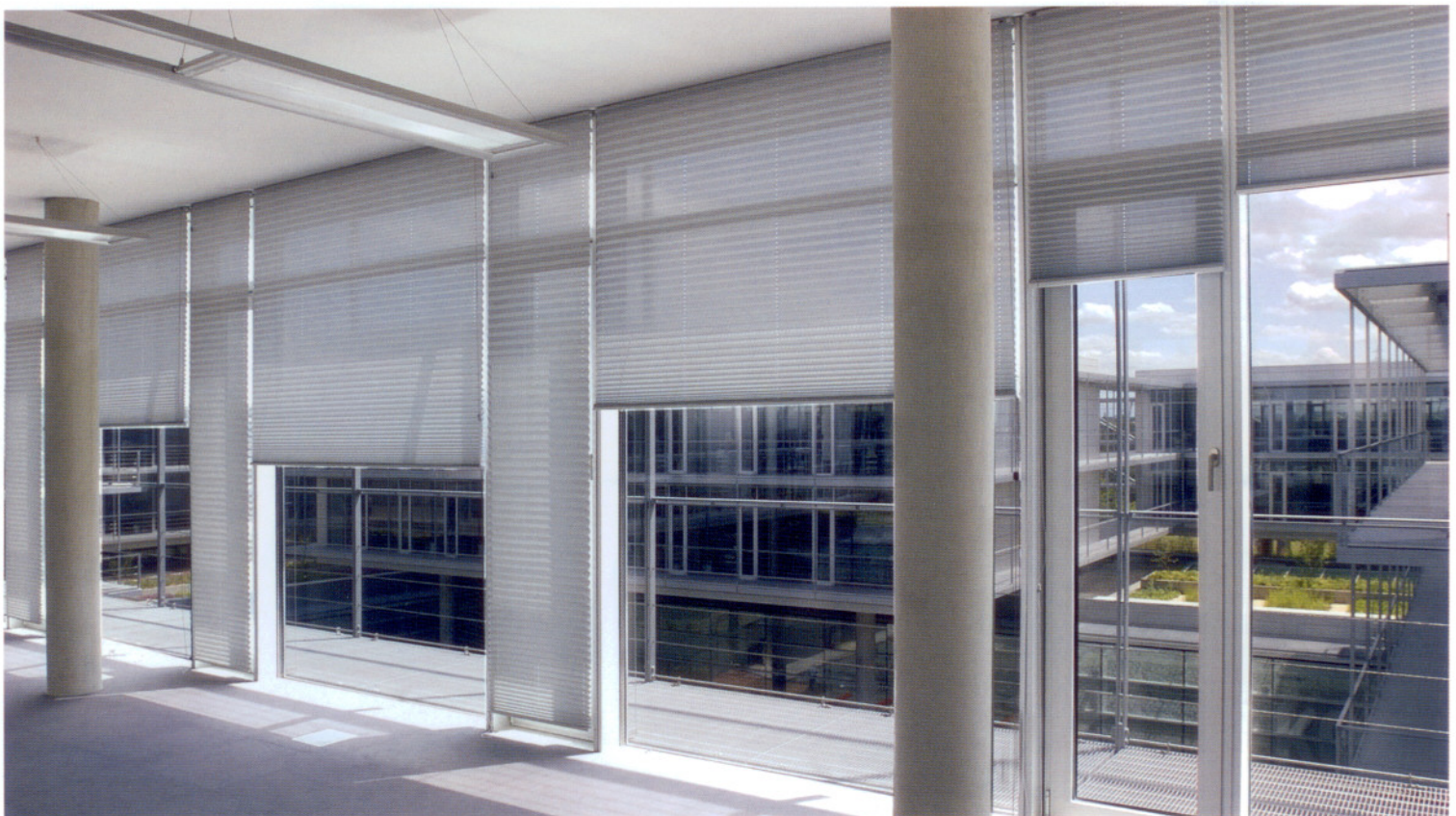
Der VDS vermittelt bundesweit spezialisierte Fachbetriebe zur professionellen Reinigung von Sonnenschutz.

Zu den Zielen des 1999 gegründeten VDS gehören unter anderem die sach- und fachgerechte Reinigung von Sonnenschutz, Beratung für den Fachhandel und Endverbraucher, die Qualitätssicherung und Einführung einheitlicher Standards, das Erstellen von Gutachten sowie die Entwicklung neuer Reinigungstechniken. ■ RAD