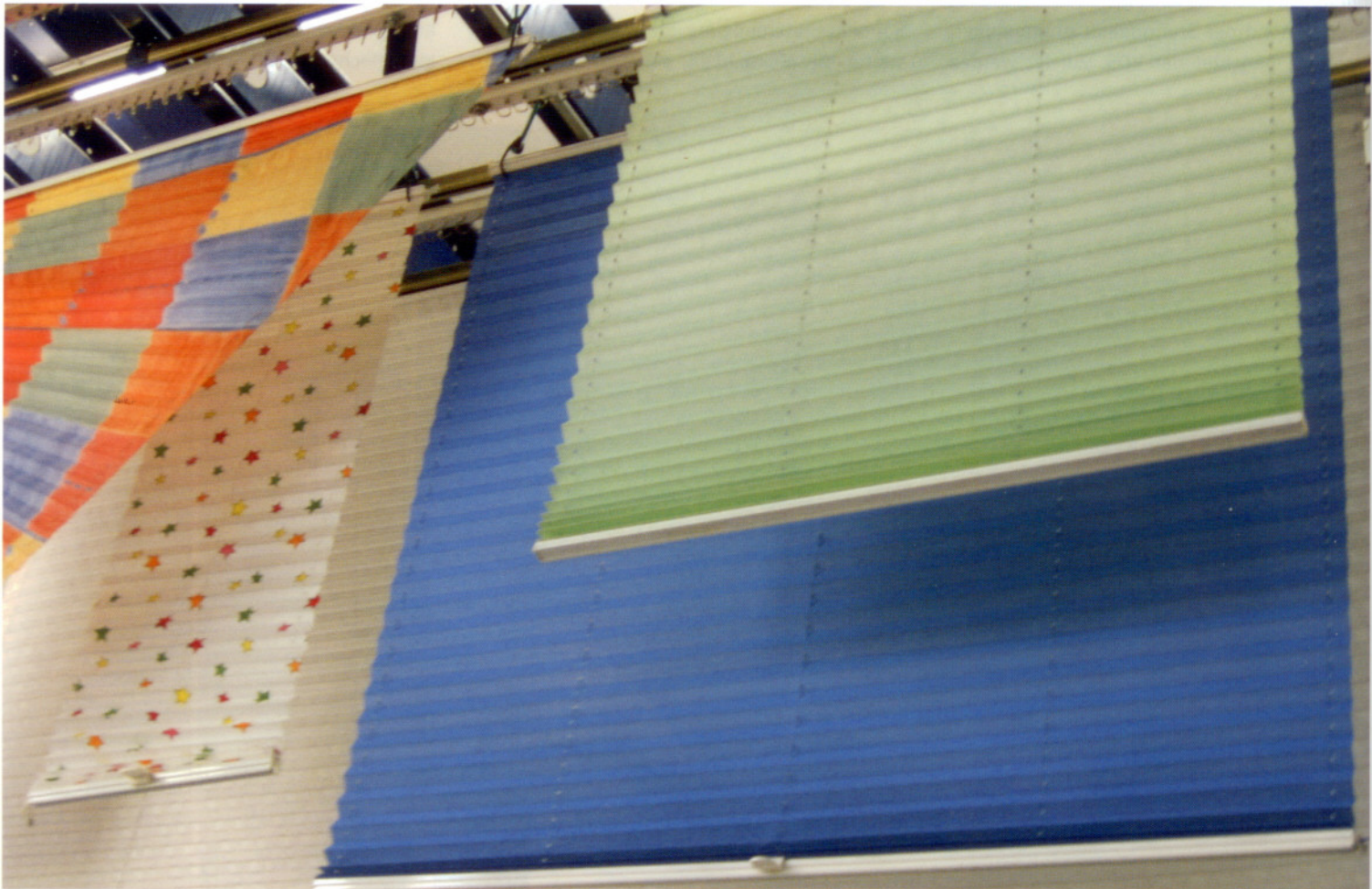
Immer komplexere Ausrüstungen und Beschichtungen erfordern modernste Reinigungstechnik: Plissee nach dem Waschen.